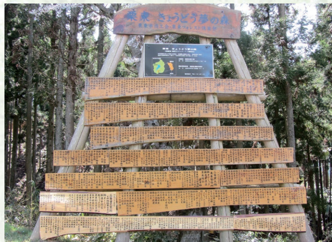
県民の森前に設置した協賛事業所名入り看板