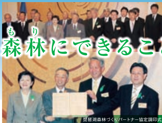
琵琶湖森林づくりパートナー協定調印式